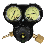
マスターVI OG 工業用酸素調整器の定番 関東式OG・関西式OF