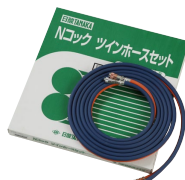
Nコック ツインホースセット