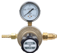
マスターIII LP 工業用LPG調整器の定番